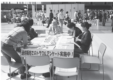
アンケート調査実施

例年、会員団体と会員の身近な方への配布回収ですすめていきましたが、回収率アップと多くの消費者への啓発をめざし、今年は会員団体の催事会場でもアンケート調査を行いました。