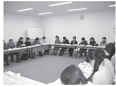
↑ 12月委員会には24名参加

消費者と消費者団体の推薦者から構成している活動委員会。今年度は31人が登録し、月1回委員会を開催しています。活発な意見交換や調査活動をおこない、事業者の不当行為などへの改善要望を行うなど、被害の未然防止、拡大防止の活動につなげています。