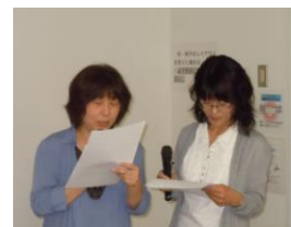
◆活動委員による報告

最後に事務局より、2013年度の活動委員32人（公募23人・団体推薦9人）を紹介し、総会を終了しました。