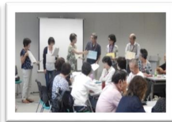
「だまされないで・・・」ミニ寸劇の発表の様子