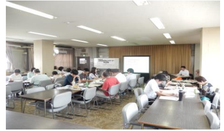
消費者被害防止サポーター養成講座