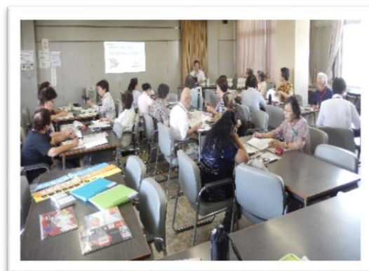
熊谷会場の様子 7月11日

民法は多岐にわたり分かりにくいものですが、ピンポイントで解説していただき、改正部分がわかりました。身近な事例で大変分かりやすく学ぶことができました。