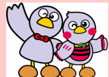
埼玉県マスコット コバトン さいたまっち

また、埼玉県を通じて埼玉県内63市町村の消費者行政担当課と消費生活センターに情報提供しています。